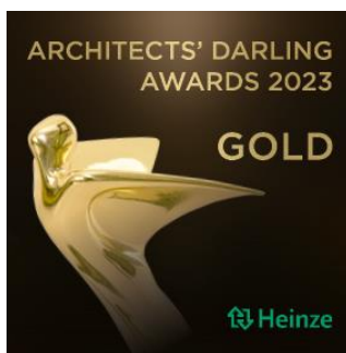
Bild 2, Bilduntertitel: Gold für HELLA bei den Architect's Darling Awards 2023

Copyright: HELLA; Bildmaterial steht für redaktionelle Zwecke frei zur Verfügung.